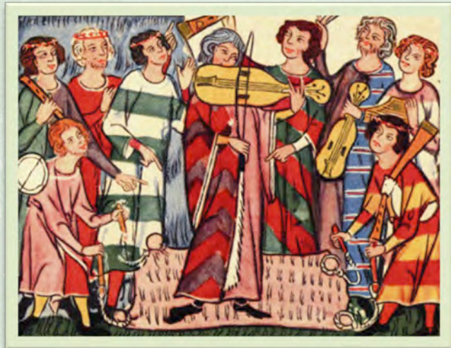
Trobadoreak eta musikariak

Konposizio berri horiek berezko ezaugarri nabarmenak zituzten. Egileak, trobadoreak , ezagunak ziren, eta musikaz lagunduta zabaltzen zituzten. Juglarea baino jantziagoak eta itzal handiagokoak ziren, baina ez ziren klerikoak. Haien artean nobleak zein plebeioak zeuden. Trobadoreen entzule gehienak aristokratak ziren, gero eta finagoak eta gerrarako grina gutxiagokoak.