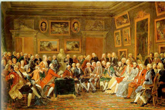
(Le Salon de Madame Geoffrin, 1755)

+ Italian, halako komedia kulta bat nagusituko da, embroglio edo enredo komedia deituko dira, gai asko hartuko dira hauetatik antzerki ingeles edota espainiarerako. Bestalde Commedia dell'Artekin eragin handia izan zuen Molierrengan.