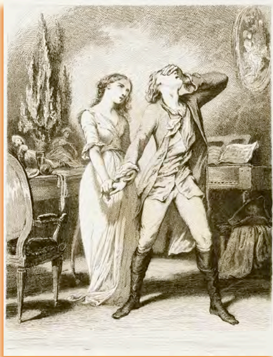
Werther gazte erromantikoa

Nobela berriak sentipenak eta pasioak deskribatuko ditu aurrerantzean, eta nobela historikoa asmatuko da, Walter Scott -en eskutik, hura izango baita sortzailea eta maisua. Haren protagonista idazlearen beraren itzala izango da maiz, idazleak bere baitan murgildurik deskribatuko baititu sentipenak, eta sortuko du mundu miresgarria, exotikoa, menturazkoa. Goethe -ren Werther izan zen horretan erromantikoaren eredu, egunkari baten gisan pertsonaiaren barrenean murgildurik haren sentipen sakonenak azaldu eta unibertsal bihurtu baitzituen.