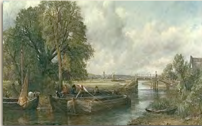
John Constable: View on the Stour near Dedham, 1822

Erromantizismoa Alemanian eta Erresuma Batuan XVIII. mende amaieran eta XIX. hasieran sortu zen mugimendu artistiko, literario, kultural eta politikoa da, Ilustrazio eta Neoklasizismoko arau aristokrata, sozial eta politikoen aurkako mugimendu iraultzailea. Pentsamendu eta idazkeraren askatasunagatik irudimen eta subjektibitatea dira mugimenduaren joera bereizgarrienetakoak, sentimenduaren garrantzia gailenduz.