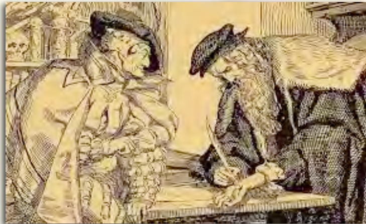
Fausto -rako egindako ilustrazioa

Baina Goetheren lanik enblematikoen bere Fausto da. Maisu lan horren lehen bertsioa 1790ekoa da; gaur egun ezagutzen den bertsioa hil aurretxoan eman zuen amaitutzat. XVI. mendetik aurrera ezagutzen zen herri literaturan Faustoren elezaharra: Fausto doktorea oso jakintsua zen, baina jakintzaren iturriekin nahikoa ez eta, liburuetan ezin bizi izan zuena dastatu eta gozatzeko deabruarekin egin zuen itun bat. Fausto -n giza arimaz eta haren pasioei buruz zituen esperientzia eta ezagutza bete bildu zuen Goethek.